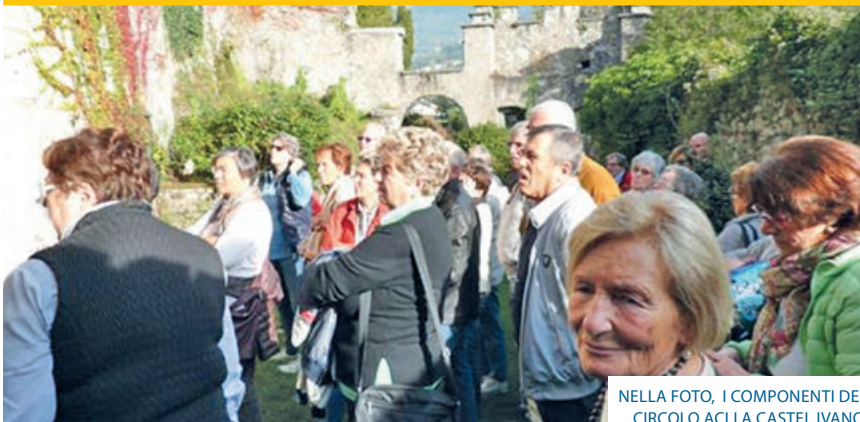
NELLA FOTO, I COMPONENTI DEL CIRCOLO ACLI A CASTEL IVANO.