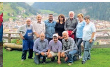
Tante iniziative molto partecipate PAGINA 10