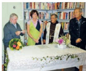
Un consuntivo ricco di iniziative importanti PAGINA 4