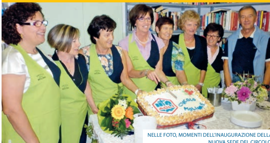
NELLE FOTO, MOMENTI DELL'INAUGURAZIONE DELLA NUOVA SEDE DEL CIRCOLO.

Con l'Assemblea dei soci di Domenica 9 Novembre per l'elezione del nuovo Direttivo si è conclusa l'attività del nostro Circolo per il corrente anno; un anno ricco di iniziative, rivolte ai soci e a tutta la cittadinanza: dall'organizzazione del posto di ristoro alla Marcialonga nella giornata di Domenica 26 gennaio; all'organizzazione tramite il CTA della gita a Roma dal 24 al 27 marzo, con l'udienza papale in piazza S. Pietro;