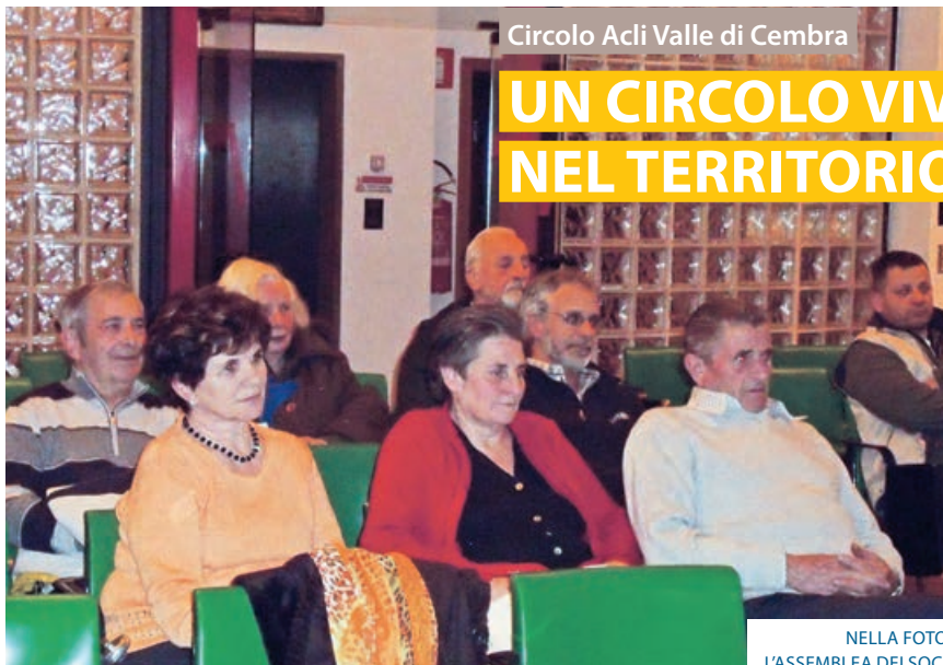
NELLA FOTO, L'ASSEMBLEA DEI SOCI.

Il Circolo ACLI Valle di Cembra è formato dagli iscritti della parte medio alta della valle distribuiti in otto paesi.