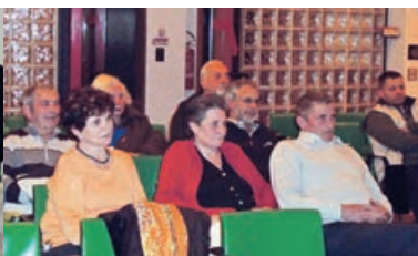
Un Circolo vivo e ben inserito nel territorio PAGINA 6