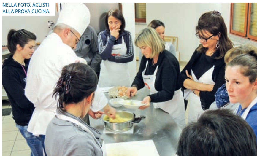
NELLA FOTO, ACLISTI ALLA PROVA CUCINA.