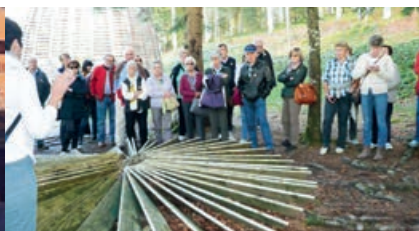
Autunno col Circolo Acli di Cavalese PAGINA 8