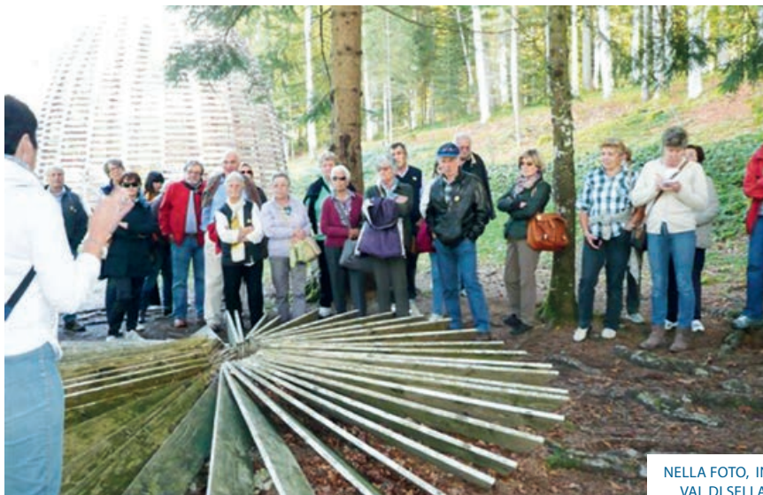
NELLA FOTO, IN VAL DI SELLA.

un'associazione per lo sviluppo locale del concetto d'arte nella natura e le novità proposte dagli artisti in quel periodo ha costituito la loro fortuna. Arte Sella è un vero e proprio museo all'aperto, ricco di installazioni artistiche di autori diversi, di cui la più rappresentativa è senza dubbio la Cattedrale Vegetale.