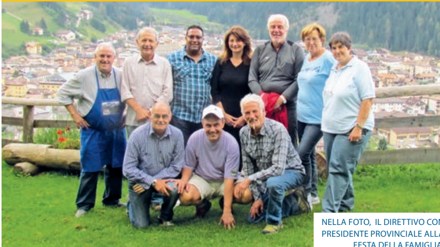
NELLA FOTO, IL DIRETTIVO CON PRESIDENTE PROVINCIALE ALLA FESTA DELLA FAMIGLIA.

Anche il 2014 sta avviandosi alla fine ed è ora di tirare le somme di quanto fatto durante questo impegnativo anno iniziato in febbraio con la giornata del tesseramento che vede un cospicuo aumento di iscritti raggiungendo ben 250 soci solo nel Comune di Predazzo e 420 tesserati tra alta Val di Fiemme e Val di Fassa.